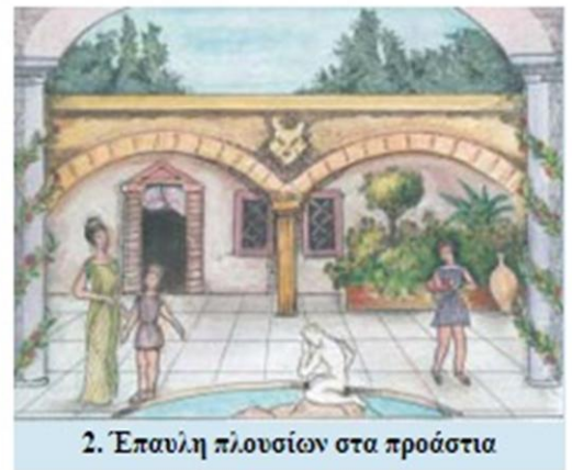
2. Έπαυλη πλουσίων στα προάστια