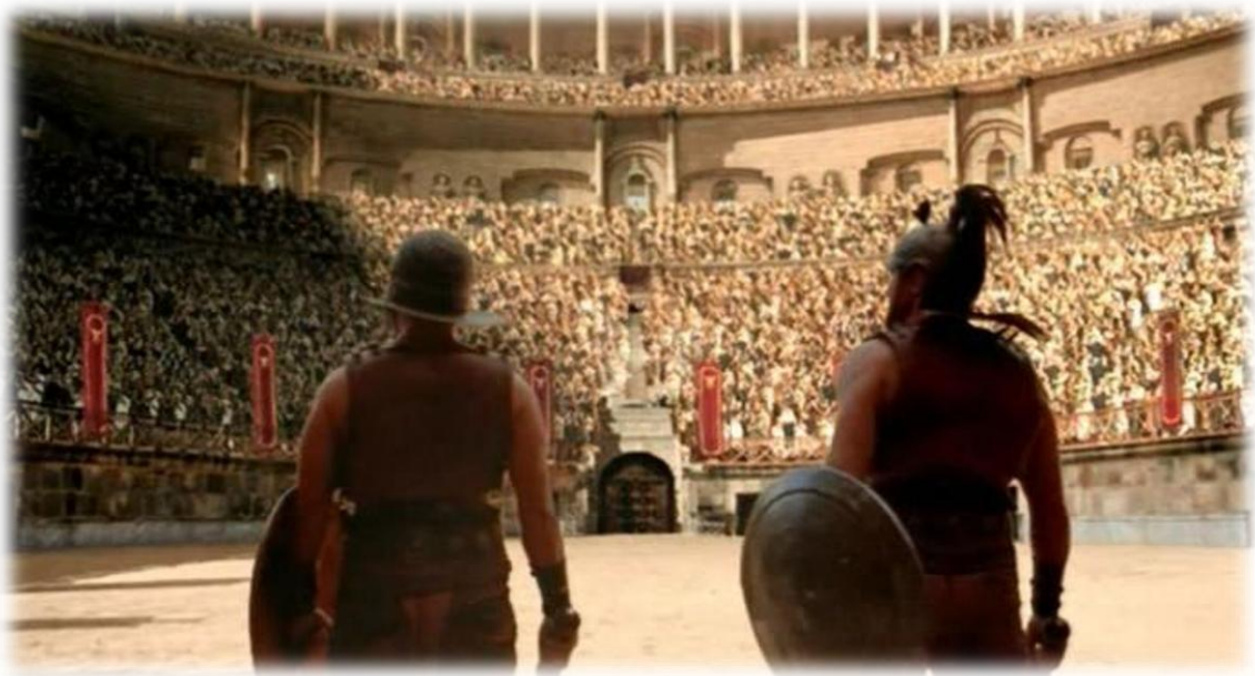
Αγώνας στο Κολοσσαίο.