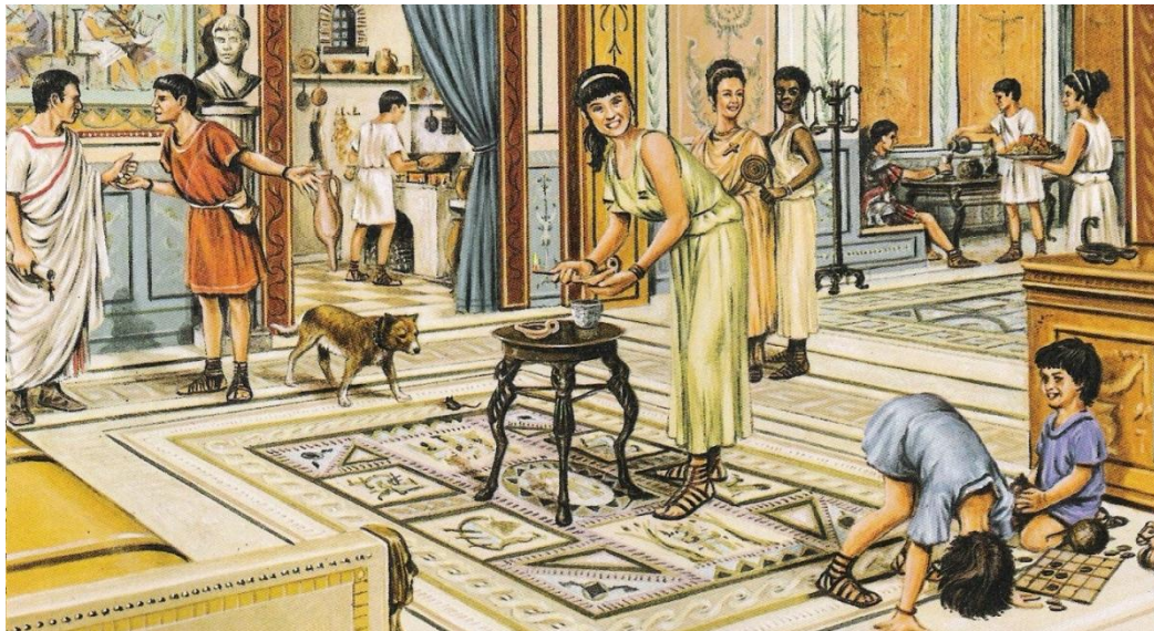
Αναπαράσταση μονοκατοικίας στα προάστια.