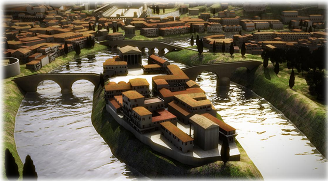
Αναπαράσταση της αρχαίας Ρώμης. Τίβερης ποταμός.