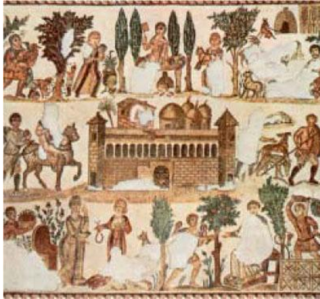
3. Ψηφιδωτή παράσταση ρωμαϊκού αγροκτήματος (Τύνιδα, Εθνικό Μουσείο)

Στα αγροκτήματα η ζωή ήταν πιο αργή αλλά και ιδιαίτερα σημαντική για την ευημερία της αυτοκρατορίας. Οι μεγάλες καλλιεργήσιμες εκτάσεις ανήκαν στους πλουσιότερους Ρωμαίους οι οποίοι προμήθευαν τη Ρώμη με πολλά προϊόντα. Η έπαυλη του ευγενή βρισκόταν στο κέντρο του κτήματος. Γύρω του ήταν χτισμένα τα σπίτια των δούλων και των καλλιεργητών, λαχανόκηποι και αμπέλια.