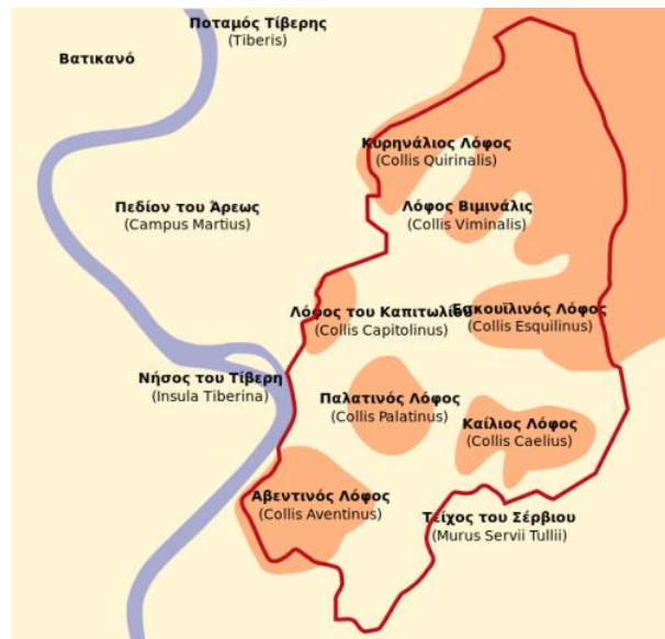
Οι Επτά Λόφοι της Ρώμης

Η Ρώμη χτίστηκε πάνω σε επτά λόφους που βρίσκονται στα ανατολικά του ποταμού Τίβερη. Αρχικά τους επτά λόφους κατελάμβαναν μικροί οικισμοί και εγκαταστάσεις, οι οποίοι ήταν ξέχωροι μεταξύ τους και όχι ενωμένοι ή αναγνωρισμένοι ως μία πόλη με την ονομασία "Ρώμη". Οι κάτοικοι των επτά λόφων άρχισαν να συμμετέχουν σε μια σειρά θρησκευτικών αγώνων και δημιούργησαν δεσμούς μεταξύ τους και ενώθηκαν. Οι αυτοκράτορες κατοικούσαν στον Παλατινό λόφο. Ο Αύγουστος τον επέλεξε σαν την κατοικία του και οι μετέπειτα αυτοκράτορες θα ακολουθήσουν την επιλογή του όπου θα χτιστούν τα αυτοκρατορικά ανάκτορα. Η πόλη της Κωνσταντινούπολης χτίστηκε και αυτή επί επτά λόφων κατά το πρότυπο της Ρώμης.