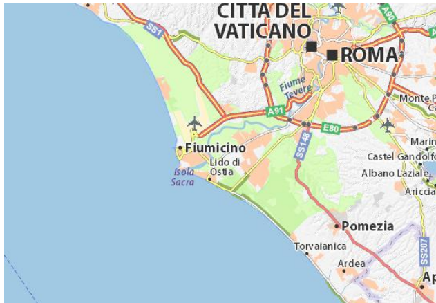
Σύγχρονος χάρτης, Όστια.