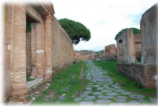
Όστια, αρχαιολογικός χώρος.

Στην εκβολή του ποταμού Τίβερη, 25 χιλιόμετρα από τη Ρώμη βρισκόταν η Όστια, το λιμάνι της αυτοκρατορικής Ρώμης. Ιστορικά, η Όστια ήταν μια πόλη σφύζουσα από ζωή όπου ανθούσε το θαλάσσιο εμπόριο.