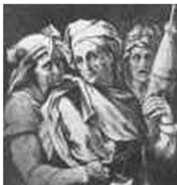
5. Οι τρεις Μοίρες: η Κλωθώ γνέθει το νήμα της ζωής, η Λάχεσις το τυλίγει—εδώ φαίνεται να παρακολουθεί—και η Άτροπος το κόβει. (Έργο του Μ. Αγγέλου, 1475-1564)

(Ν. Πολίτης, Παραδόσεις Α', σ. 561, εκδ. Εργάνη, Αθήναι 1965)